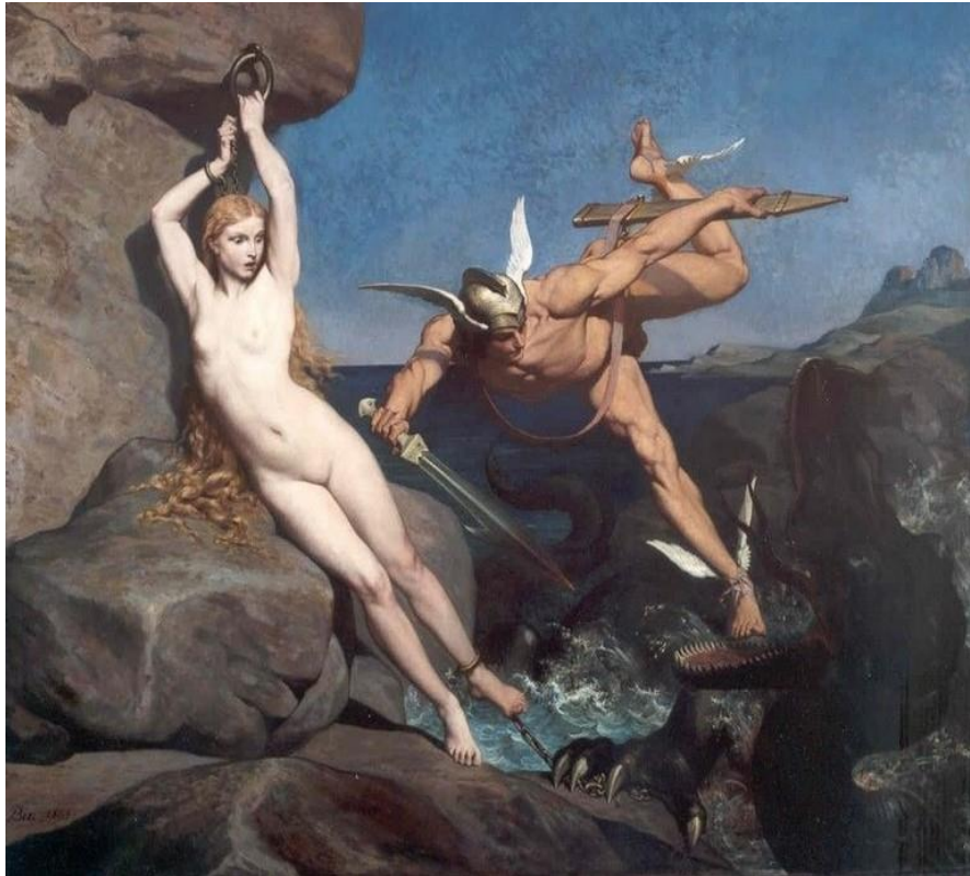
Persée délivrant Andromède – Tableau d'Émile Jean Baptiste BIN – 1865