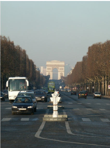
Vue depuis la Concorde

Plus on s'approche de l'Arc, plus le sommet de la Grande Arche est haut sur l'horizon et plus le diamètre apparent de l'arche augmente, alors que le diamètre apparent du Soleil reste constant.