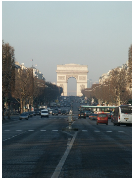
Depuis le rond-point Élysées Clemenceau